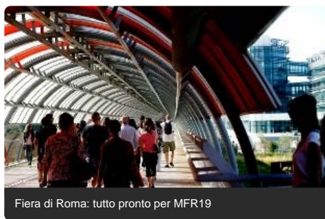
Fiera di Roma: tutto pronto per MFR19

Economia circolare, robotica, intelligenza artificiale, Internet delle cose e poi ancora tecnologie per l'educazione, la formazione, l'arte contemporanea, l'agricoltura sostenibile tra i temi protagonisti dell'edizione 2019. Filo conduttore dell'evento l'impatto ambientale zero. La Rai è main media sponsor della manifestazione