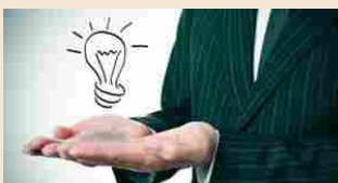
INNOVAZIONE | 12 marzo 2019 Ue, sui brevetti l'Italia rallenta ma resta nella top 10

L'obiettivo è quello di rendere InnovAgorà un appuntamento annuale che si ponga come strumento di conoscenza e valorizzazione della migliore ricerca italiana. « Milano si trasformerà in una piazza di scambio - ha detto infatti il ministro -, faremo incontrare domanda e offerta di sviluppo».