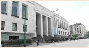
PROPRIETÀ INTELLETTUALE | 02 maggio 2019 Corte Ue dei brevetti, Milano prepara la candidatura

Durante la manifestazione i ricercatori potranno mostrare i prodotti del loro studio e le aziende potranno toccare con mano le nuove tecnologie e i prototipi progettati nelle università. «L'Italia - ha detto il ministro - si contraddistingue per un'alta densità scientifica che deve tradursi in una commisurata risposta in termini di brevetti. Attraverso questa manifestazione dimostreremo come la ricerca può e deve essere concretamente