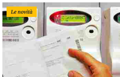
Bollette vecchie non pagate, quando cadono in prescrizione