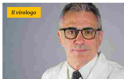
L'allarme di Pregliasco: «I casi saliranno ancora, primo effetto scuole»