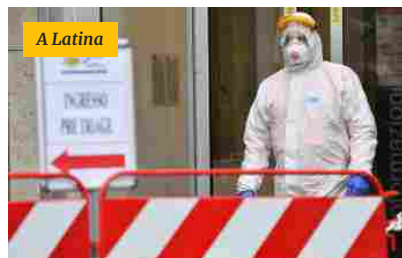
Allarme Covid nel Centro Italia, scatta subito mini lockdown per due settimane