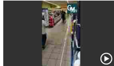
Potenza, bomba d'acqua sulla città: si allaga un supermercato