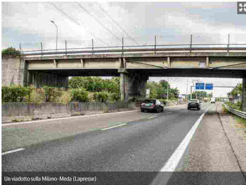
Un viadotto sulla Milano-Meda

A ogni emergenza meteo viene giù un pezzo di viadotto ligure. Durante la penultima, era la fine di settembre, dal ponte Bisagno dell'autostrada A12 si è staccato un pluviale, un tubo per lo scolo dell'acqua piovana, che è precipitato in mezzo a una strada della periferia di Genova. Il giorno dopo gli abitanti del quartiere hanno dato vita a un breve corteo per chiedere lumi sulle condizioni di quella striscia di asfalto che scorre sopra le loro teste. Peccato che non ci sia ancora nessuno a cui chiedere, a parte i gestori privati che nel recente passato non hanno certo dato grande prova di sé. Il passaggio "istantaneo" dalla logica dell'emergenza delle infrastrutture a quello della prevenzione annunciato nel trigesimo della tragedia del ponte Morandi dall'allora ministro Danilo Toninelli risulta ancora in corso oggi, a un anno e mezzo di distanza da quella mattina del 14 agosto.