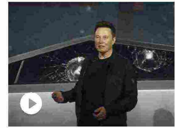
Cybertruck, disastrosa presentazione: Musk testa i finestrin...

Avrebbero bisogno di continui controlli, ma si torna alla casella di partenza. I soldi non ci sono. I rivi esondano, la terra si inzuppa, i viadotti cedono. Nei vari rapporti sui punti critici delle rete viaria italiana prodotti nei mesi dopo il Ponte Morandi, erano citati come come "preoccupanti" ben quattro ponti della A6 Torino-Savona, equamente divisi tra Piemonte e Liguria. Quello crollato ieri